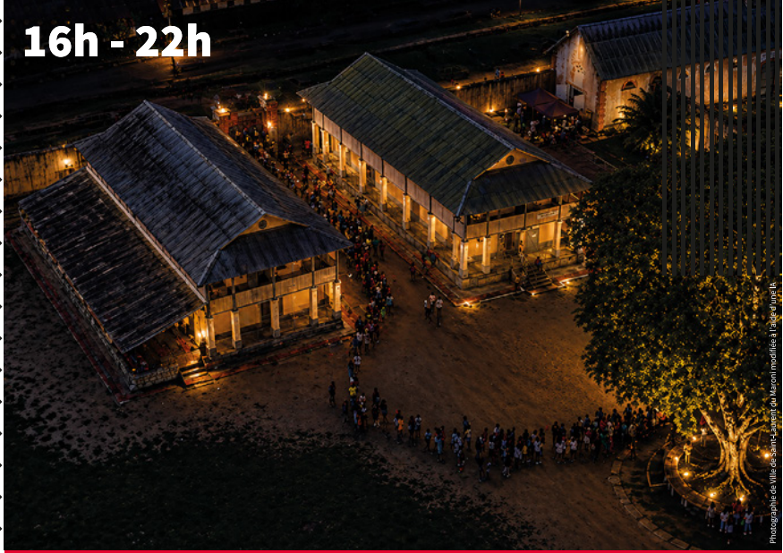
Photographie Ville de Saint-Laurent du Maroni modifiée à l'aide d'Inkscape