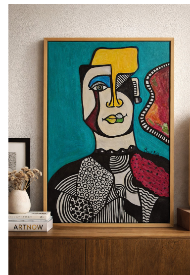
© Peinture sur toile intitulée Golem , Gersi Reis

Rencontre avec l'artiste de 20h30 à 21h00